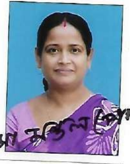
সোমা মঙ্গল (পাত্র)

উপরোক্ত আঙ্গুলের টিপ ও ছবি আমার সোমা মঙ্গল (পাত্র)